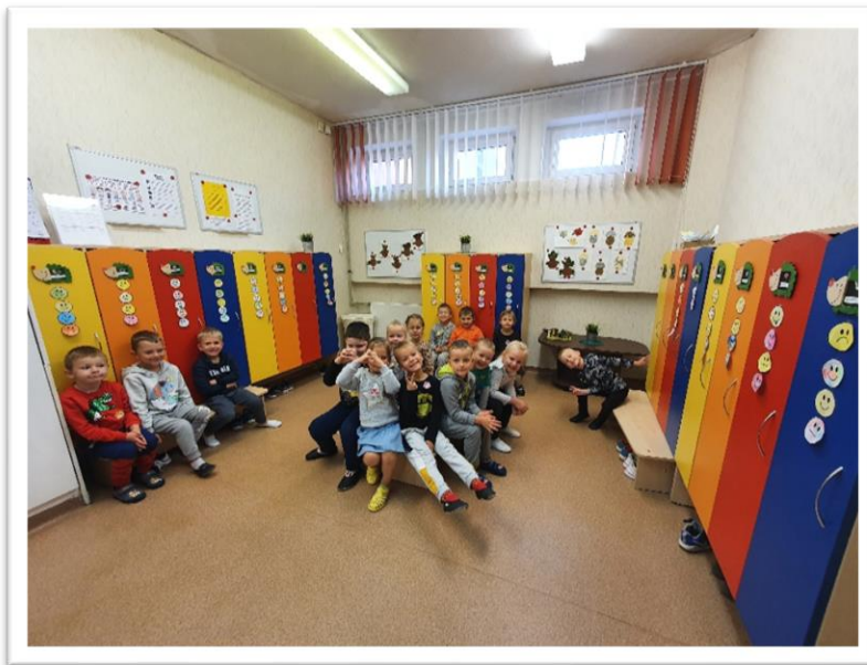
„Trijų švieselių“ grupė